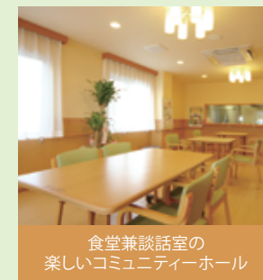
食堂兼談話室の 楽しいコミュニティーホール

カラオケや近くの保育園との交流 などのイベントを実施しています。 また、娯楽室の増設を予定してい ます。